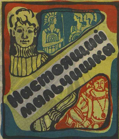
Рис. Н. САВЕЛЬЕВОЙ.

НУ КОГО до войны заботило, робок или смел полый учитель Януш Корчака? Что добр — это знали точно. Добр и милок до крайности, до неслепоты. В детском доме, где Корчак воспитывал ребят, был свой «Свод законов», его преступлений и в девятую десятку случаев одно наказание — простить.